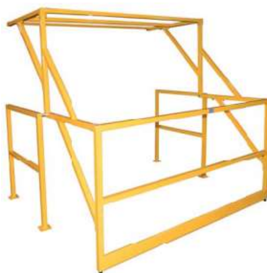
Position ouverte pour recevoir une palette